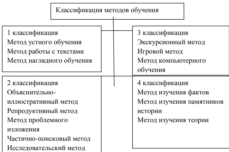
Рис. Классификация методов обучения праву